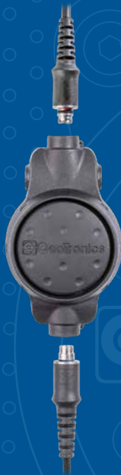
CT-MultiPTT 1C Plus